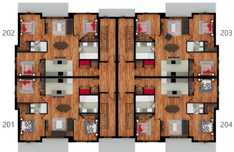
ETAGE 1 2019